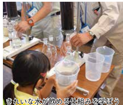
きれいな水が飲める仕組みを学ぼう

市では、市内の産業や行政機能、観光の名所などを広く知っていただくとうと、バスで行く「親子公共施設等見学会」を8月9日（金）9時から15時40分までの予定で開催します。