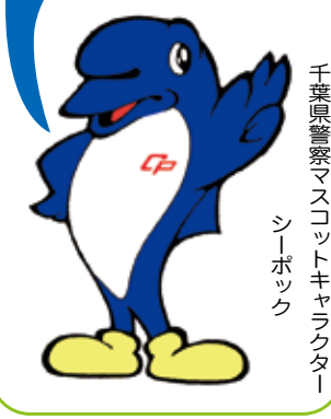
千葉県警察マスコットキャラクター シーポック