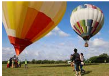
ゴンドラは高さ20メートルに上昇

約400人が搭乗。隣り合った熱気球のゴンドラの中から、体験搭乗者が互いに手を振り合う光景も。