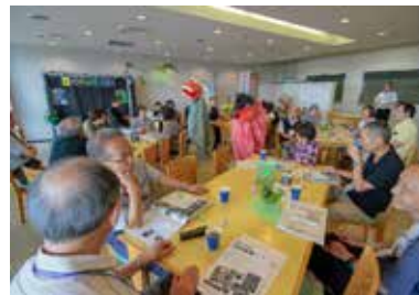
コーヒーを楽しみながら会話も弾んで

「興味深い団体ばかりなのでじっくり考えたい」と話す方も。※次回は子育て世代対象、来年1月開催予定