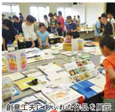
創意工夫にあふれた作品を展示