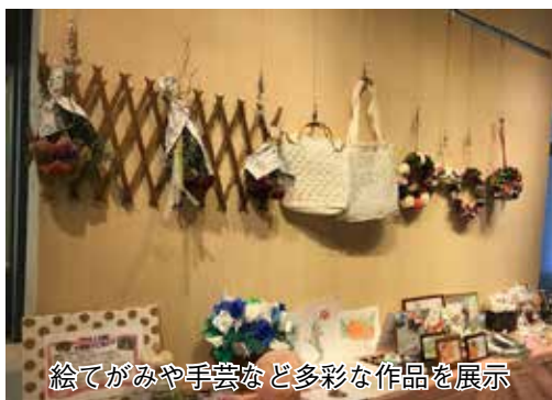
絵てがみや手芸など多彩な作品を展示

市内介護施設に入所する高齢者による作品や施設内の様子を撮影した写真や説明パネルなどを展示します。