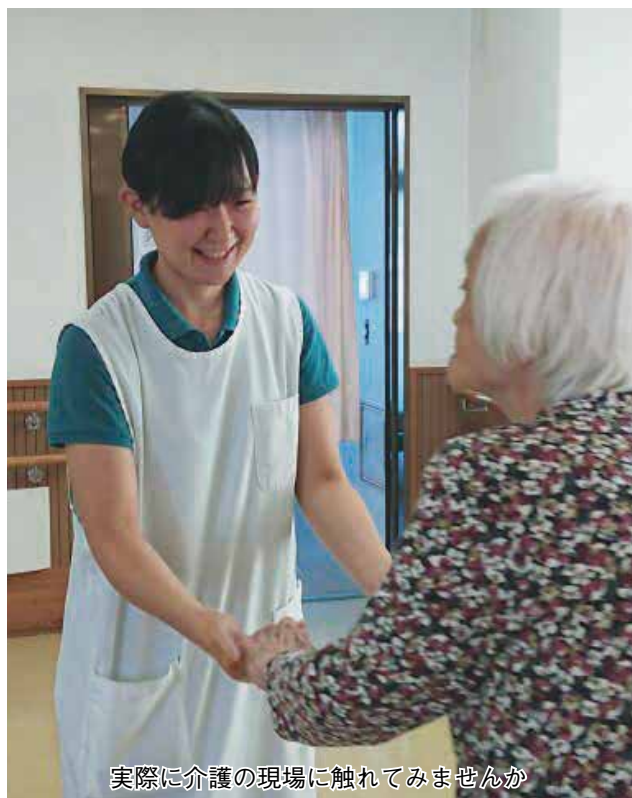
実際に介護の現場に触れてみませんか

【開催期間】9月4日(木)～10日(火) 8時30分～17時15分(初日は11時から、最終日は15時まで)【場所】市役所ふれあいギャラリー