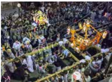
「やんわりまえた」など独特のかけ声も

活し、4基の子どももみこしと市内各地から集まった12基の大人みこしが本町通りを中心にパレード。華やかなみこしや威勢のいい担ぎ手をカメラやスマホに収める観衆の姿も数多く見られた。