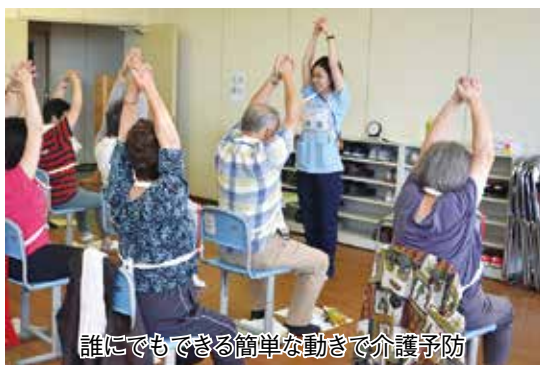
誰にでもできる簡単な動きで介護予防