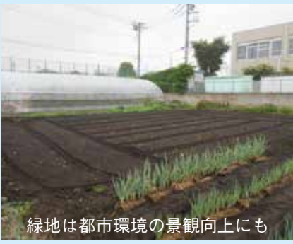
緑地は都市環境の景観向上にも