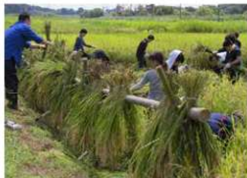
今年の市民農園の稲刈りは9月1日を予定