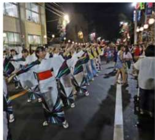
美しくそろった踊りで第二中学校が最優秀賞に輝く

野田夏まつり踊り七夕が8月3日、4日に本町通りを中心に行われ、約11万8千人の観客でにぎわった。