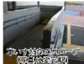
車いす対応のスロープ (写真は愛宕駅)