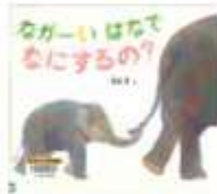
「ながーいはなでなににするの?」 著者 横一・さく 野田図書館

千葉県で見かける動植物をまとめた本。千葉県や環境省選定の絶滅危惧種や天然記念物などをアイコンで紹介しています。ぜひ、野田市で見かける動植物を探してみてください。