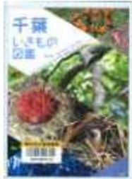
「千葉いきもの図鑑」 著者 津一・解説 前田 信二・写真 メイツ出版

奥原図書館 ☎7123-7611 南図書館 ☎7125-7381 北図書館 ☎7129-8811 せきやど図書館 ☎7198-4046