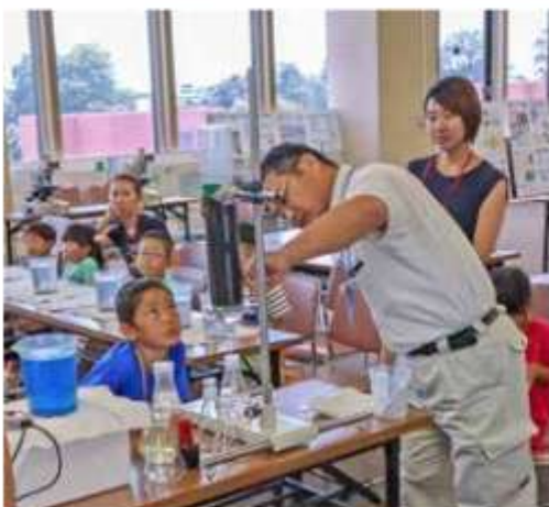
浄水場では100項目以上の検査で安全を確認

市は夏休みを利用して子どもたちに公共施設の役割を知ってもらおうと、8月9日に親子公共施設等見学会を開催し、親子19人が浄水場と北千葉浄水場(流山市)を見学した。