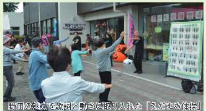
野田の魅力と歌詞と動きに取り入れた「えだまめ体操」