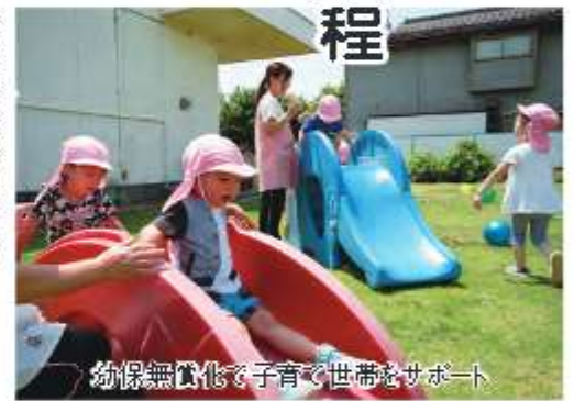
幼保無償化で子育て世帯をサポート

令和元年第3回定例市議会は、8月30日から9月25日までの会期で開催されています。今議会では、幼稚園や保育所などの無償化のほか、16議案を上程し審議されています。