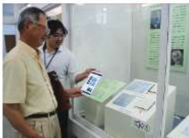
記念館初の音声ガイドは10言語対応

記念館初の音声ガイドは10言語対応。音声ガイドには、「カタログポケット」（4面参照）を利用し、スマートフォンなどで会場内外のどこでも利用可。「もう一度家で読んで、興味を持ったところを調べたい」と話す来館者もいた。