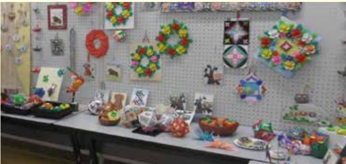
さまざまな作品が会場を彩ります

【日時】 11月23日(土)9時～16時、11月24日(日)9時～15時 【作品展示】 水引アート、絵手紙、書道、クラフトドール、折り紙、小学校・中学校作品など 【舞台発表】 小学校・中学校吹奏楽、大正琴、健康体操、合唱、フラダンス、民謡、詩吟、カラオケ、空手、ダンス、着付け、バレエなど 【問合せ】 二川公民館 ☎ 7196・2020 【HP検索】 1023912