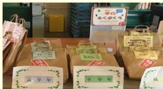
昨年の福袋 小学生向け (興風図書館)