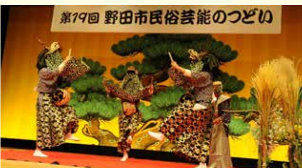
3年ぶりの出演となる下根獅子舞保存会

【日時】 12月1日(日)正午開演(11時30分開場) 【会場】 樺のホール・小ホール 【入場料】 無料 【出演団体】 中里喜楽会、七光台お囃子保存会、中野台大杉ばやし、鶴嶋はやし会、下根獅子舞保存会、本郷囃子愛好会、中央小学校、宮崎小学校、清水台小学校、川間中学校、福田第一小学校、東部小学校 【問合せ】 野田市民俗芸能のつどい実行委員会事務局(生涯学習課) ☎ 7125・1111(内線2655) 【HP検索】 1023959