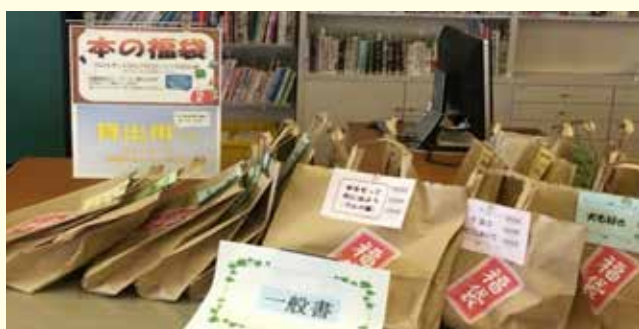
昨年の福袋 一般向け (興風図書館)