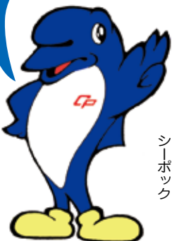
千葉県警察マスコットキャラクター シーポック