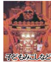
子どもみこしなどの出町自治会が備品を整備。 岡市民生活課

◆野田市公共下水道運営審議会 10月25日(金)15時から市役所8階大会議室で。先着10人。14時30分から受付。 岡下水道課