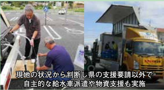
現地の状況から判断し県の支援要請以外で自主的な給水車派遣や物資支援も実施