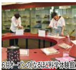
6月1日のほりこども園科学体験館