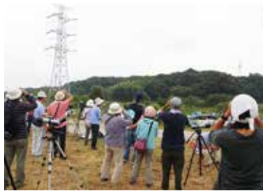
上昇気流を利用してグライダーのように飛ぶ

利根運河の生態系を守る会では、県内のタカ(サシバ)が東南アジア方面で越冬するため群れで飛ぶ、渡りルートに位置するところの里で、9月29日に観察会を開催した。タカの渡りは、9月から10月の晴天で東風が吹く日に観察できる。当日は群れを確認できなかったが、今季累計で37羽の渡りを確認したという。