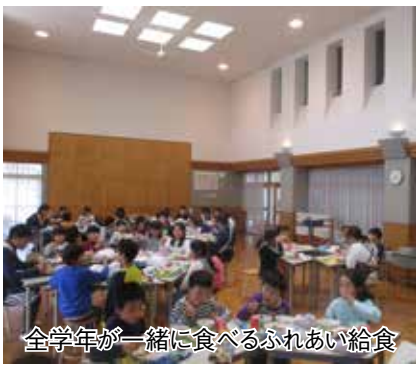
全学年が一緒に食べるふれあい給食

小規模特認校は、少人数でクラス編成し、少人数ならではの教育や指導、各種体験活動を通