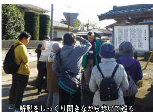
解説をじっくり聞きながら歩いて巡る