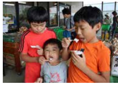
黒酢米は野田市のブランド農産物

収穫した黒酢米の炊きたてを試食提供。おいしさに舌鼓を打った買い物客は、そのまま特別価格で限定販売された新米を買い求め、両日とも好評で完売した。