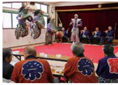
昭和54年に旧関宿町の文化財に指定