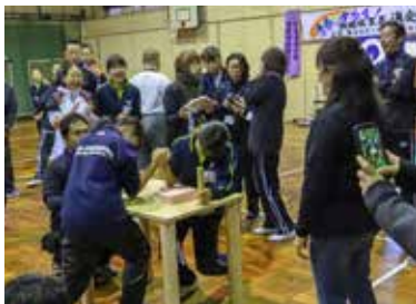
熱戦の前後には相手に一礼