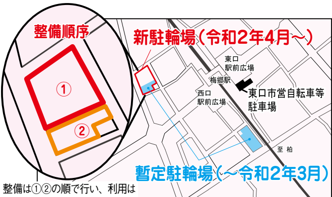
整備は①②の順で行い、利用は新駐輪場①が完成してから開始 料金は令和2年3月までは無料