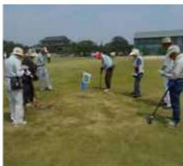
マナーを守って楽しくプレー

合は15日(9時)か16日(9時)に延期。申込みは3月8日(9時)～15日(9時)に直接関宿総合公園体育館窓口へ7198・8500へ