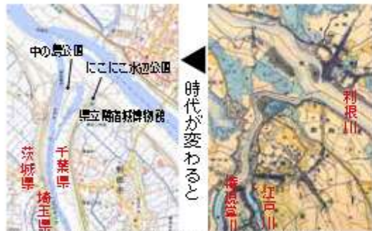
権現堂川(左下)の名残が茨城埼玉の県境に