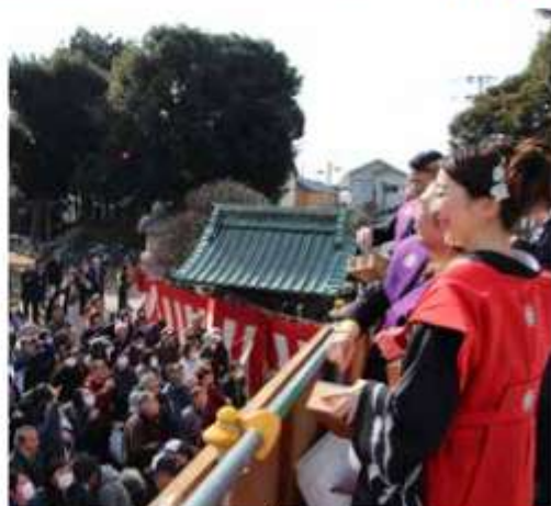
事故防止のため幼児や高齢者には福豆を直接手渡す場所も