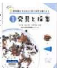
「自然史博物館の達人たちが、生き物や鉱物の見つけ方、観察、工作や標本作り、発表の仕方も教えてくれます。百円ショップの道具で大丈夫、自然の研究を始めてみませんか。」

江戸庶民の好奇心を満たした「瓦版」。歴史的出来事から災害に敵討ち、果ては怪異の目撃談まで。数々の瓦版をフルカラーで掲載し、当時の大人気メデイアについて解説します。