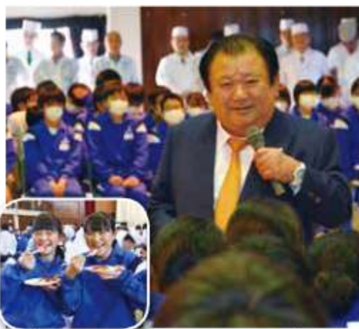
マグロ解体ショーとすしが振る舞われるサプライズも

キャリア教育の一環として木間ヶ瀬中学校は2月6日に、卒業生で全国にすしチェーン店を展開する木村清氏の講演会を行った。