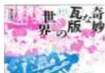
「奇妙な瓦版の世界」

興風図書館 ☎7123-7611 南図書館 ☎7125-7381 北図書館 ☎7129-8811 せきやど図書館 ☎7198-4046