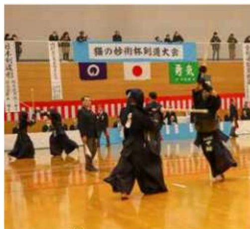
2回目の開催に1都6県から500人が集う

避難所など日常と異なる環境に強いストレスを感じる方も支援が必要です。特に、避難所などではヘルプマークを身に付けている方がいたら、声を掛けるなどの思いやりのある行動を心掛けましょう。ヘルプマークは、障がい者支援課や関宿支所、各出張所、市民課(延長窓口)の開設時間のみ、社会福祉協議会、関宿福祉センターやすらぎの郷で配布しています。知人やお近くに希望する方がいましたら、教えてください。