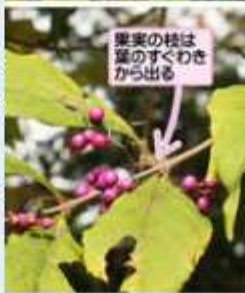
果実の枝は葉のすぐわきから出る