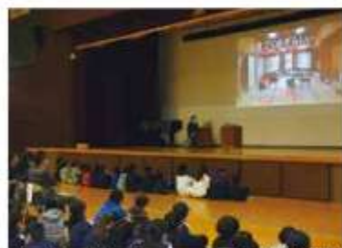
動画は中央小のホームページでも公開予定

動画は学校周辺の方と交流しながら、月かけて制作。映像には海外向けは英語字幕をテロップに入れるなど工夫した。「もっと野田が好きになった」と話す児童もいた。