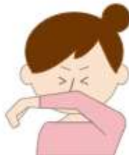
服の袖で口と鼻を覆う