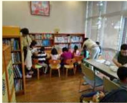
昨年度の子どもまつり工作教室

幼少の時から書物に親しみ、読書の喜びや楽しみを知り、物事を正しく判断する力をつけておくことが、子どもたちにとって最も大切なことです。大人にとっても子どもの読書の大切さを考える機会