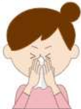
ハンカチ、ティッシュで口と鼻を覆う