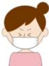
マスクで口と鼻を覆う