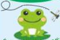
たぐさんの生き物と共生