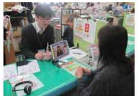
タブレットで手話通訳者と中継

4月1日から野田市手話言語条例が施行されました。県内の市町村でも審目の制度で、手話が言語であるとの認識に基づき、手話の理解を広げ、全ての市民が地域で支え合い、安心して暮らせる共生社会の実現を目指します。条例では、手話を使いやすい環境の整備や手話の普及を進めることを定めています。そこで、市では、現在実施している意思疎通支援者派遣事業などに加え、今年度から新たに全国手話検定試験受験料への助成金交付やタブレット端末を用いた遠隔手話