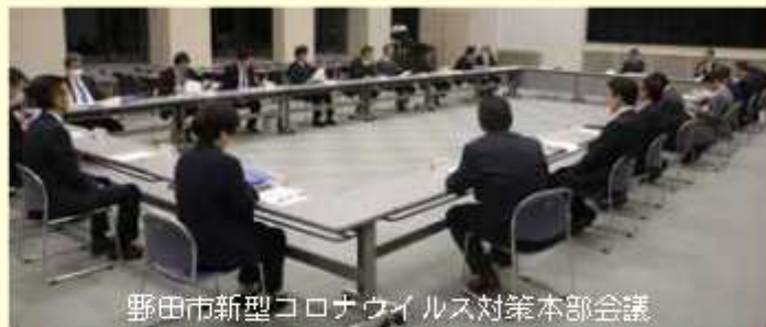
野田市新型コロナウイルス対策本部会議