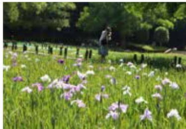
白や紫、青といった花が満開

総合公園内の水生植物園では50種1万5千本のハナシヨウブが花を咲かせ、6月下旬に見頃を迎えた。同園内が淡い紫色に染まる中、「今年はコロナウイルスの影響で、眺めに来られないと思っていたけど、外出自粛も解除されたので久し振りの散歩で来てみた。きれいに咲いていて感動した」と話す来園者も。