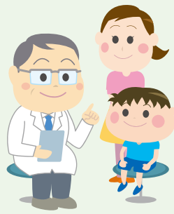
安心して子育てを

子育て中は、何かとお金がかかるものです。市では、子育て支援をさらに充実させようと、8月から子どもの医療費を負担する保護者への保険診療分の医療費