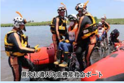
県内初導入の高機能救命ボート

市では、水難救助体制を強化するため、野田市水難救助隊を8月3日に発足し、高機能救命ボートを配備します。ボートは、がれきなどが散乱した浸水・冠水場所でも活動でき、水害で孤立した方の救助に利用します。