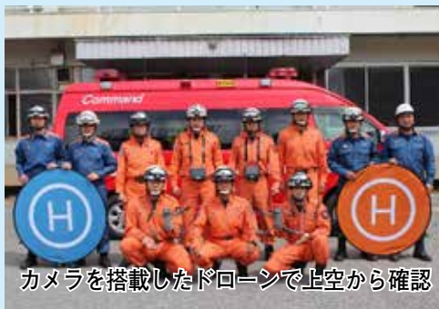
カメラを搭載したドローンで上空から確認

ほかに、無人航空機（ドローン）2機の配備により、火災現場での延焼状況確認や水害孤立者の居場所の特定、自然災害発生時の被害状況確認など、迅速