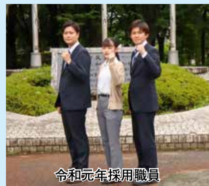
令和元年採用職員

【HP検索】①は1026232、②～⑤は1026234、⑥は1026233、⑦⑧は1026235