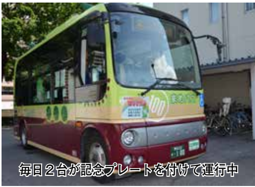
毎日2台が記念プレートを付けて運行中