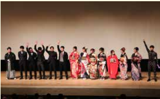
感染拡大防止のため式典は2回に分けて開催予定