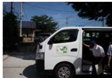
3月31日まで試験的に運行予定

交通不便地域モデル地区（小山・木野崎地域の一部）の市民を対象に実施。通院に利用した。時間が合えばまた利用したい」と話す利用者もいた。