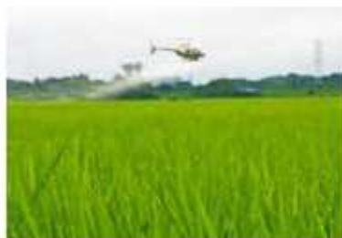
市内全稲作面積の約半分に散布

玄米黒酢は植物活力剤として、病気に負けない株を育成する効果があると考えられる。市内公立の幼稚園、保育所、小中学校、私立保育園の給食では黒酢米が食べられている。