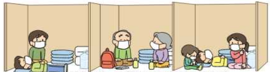
避難所では段ボールで間仕切る感染対策も実施