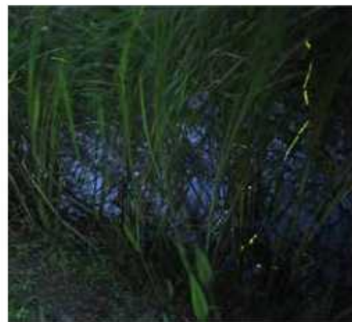
10秒露光で定点撮影した写真7枚を合成

水田型市民農園やここのとりの里など、自然豊かな環境づくりに取り組んでいる江川地区では、今夏もヘイケホタルが野田の夜を彩った。毎年、ホタル観察会を開催している野田自然共生ファームでは、「今年は感染予防で開催できず残念。来年は幻想的な光景を楽しめるようになるといいですね」と話していた。