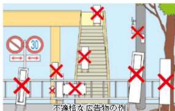
不適格な広告物の例