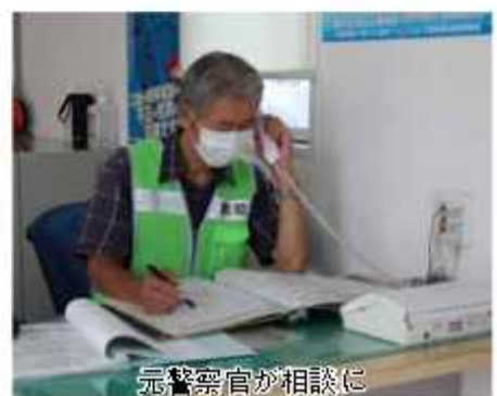
元警察官が相談に

イオンタウン野田七光台内（七光台小学校正門前）に設置している北部安全安心ステーション（北部まめばん）では、電話de詐欺やひったくりなど身の回りの犯罪に関する相談を受