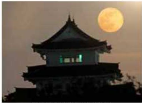
県立関宿城博物館と満月