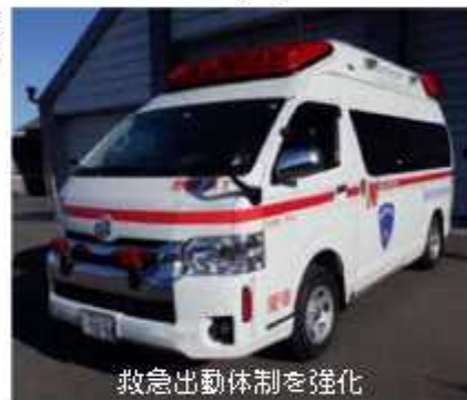
救急出動体制を強化