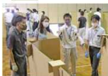
段ボールパーティションの設置を確認

酷暑にも負けず 真っ白なソバの花 人の手入れによって守られる昔ながらの美 しい里山風景を取り戻すため、三ツ堀里山自 然園を育てる会では、同園内で樹木の枝落し や下草刈り、有機農 法による稲作やソバ 栽培など、かつての 農村で営まれてきた 活動を行っている。 8月にはソバが可 憐な白い花を咲か せ、一面真っ白な光 景が広がっていた。