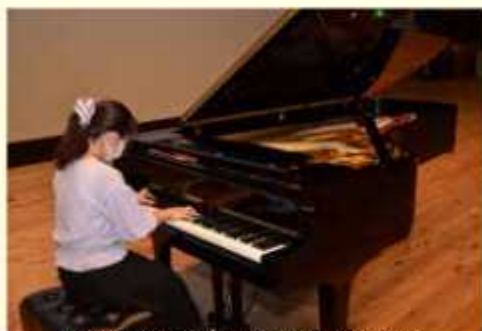
弾き込みでピアノを良好な状態に

程度は、最低音部から最高音部までのスケールが半音階、アルペジオ（スケール・アルペジオの場合は、黒鍵を含む複数の調整）を演奏