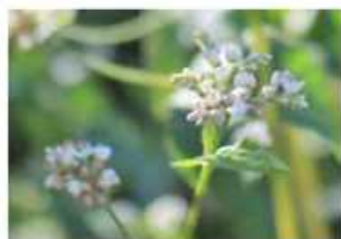
小さな白い花が集合して咲く

酷暑にも負けず 真っ白なソバの花 人の手入れによって守られる昔ながらの美 しい里山風景を取り戻すため、三ツ堀里山自 然園を育てる会では、同園内で樹木の枝落し や下草刈り、有機農 法による稲作やソバ 栽培など、かつての 農村で営まれてきた 活動を行っている。 8月にはソバが可 憐な白い花を咲か せ、一面真っ白な光 景が広がっていた。