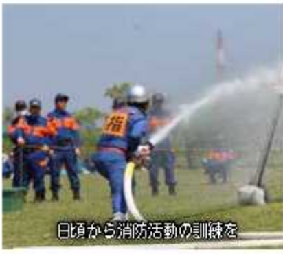
日頃から消防活動の訓練を

近年では、働き方が多様化して、地元で働く人だけでなく市外に勤めている人も多くなっています。