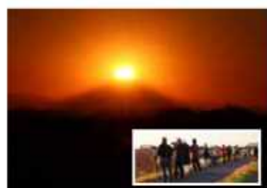
野田はダイヤモンド富士の北限地

毎年冬至の日前後に、富士山の山頂に夕日が落ちるダイヤモンド富士を見ようと江戸川玉葉橋付近に多くの人が集まる。12月23日には、土手沿いに約100人がカメラを構え、日の入りを待った。16時20分ごろに輝く太陽が山頂に重なり神秘的な光景が広がる。一斉にカメラのシャッター音があたりに響き渡った。