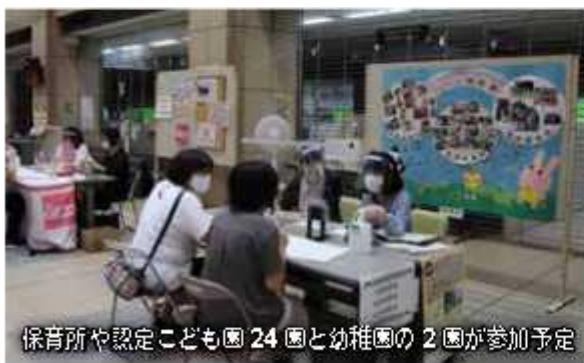
保育所や認定こども園 24 園と幼稚園の 2 園が参加予定