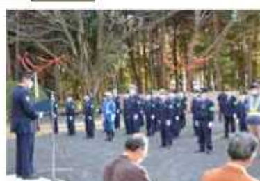
警察官による防犯活動を強化

毎年冬至の日前後に、富士山の山頂に夕日が落ちるダイヤモンド富士を見ようと江戸川玉葉橋付近に多くの人が集まる。12月23日には、土手沿いに約100人がカメラを構え、日の入りを待った。16時20分ごろに輝く太陽が山頂に重なり神秘的な光景が広がる。一斉にカメラのシャッター音があたりに響き渡った。