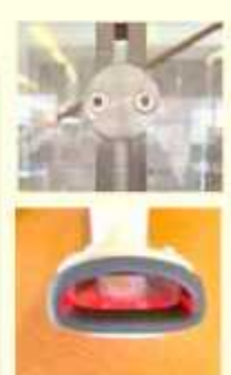
顔が見つかるかな