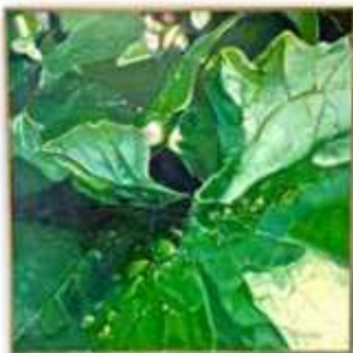
「Green Leaves Raindrops」鹿又保子(S100 油彩)