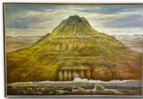
「聖城盛運」畔上房雄(F120 油彩)