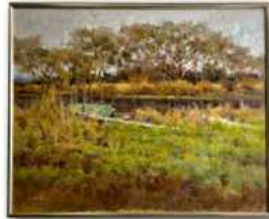
「舟ぐもり」関義雄(F100 油彩)