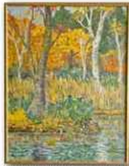
「秋惜しむ」川崎みち子(F80 油彩)