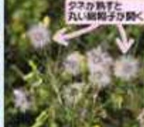
小さな花と丸い葉が可愛い