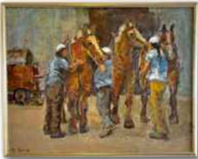
「厩舎の前で」宇野三枝子(F50 油彩)