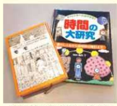
時間のふしぎやなぞを楽しもう

つの間にか町に入り込み言葉巧みに人々から時間をかすめ取っていく灰色の男たちに立ち向かう、ハラハラドキドキの冒険物語でもあり、時間について考えさせられる物語でもあります。 『モモ』 （シビヤエル・エンデン／作、大島がおり／訳 岩波書店）