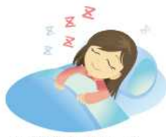
深い睡眠を心掛けましょ

良質な睡眠がとれるよう、生活習慣を見直してみましょ。 (監修：東京理科大学・柳田信也准教授)