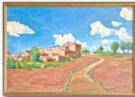
「トスカーナの空」加藤明子(F50 油彩)