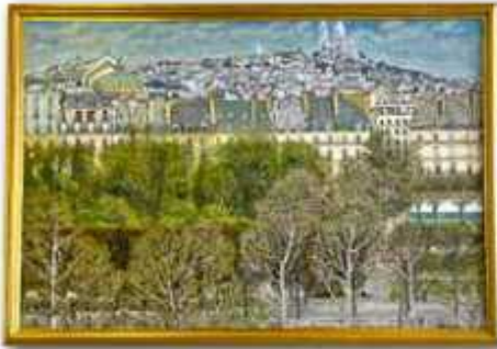
「早春(パリ)」杉嶋利男(F120 油彩)