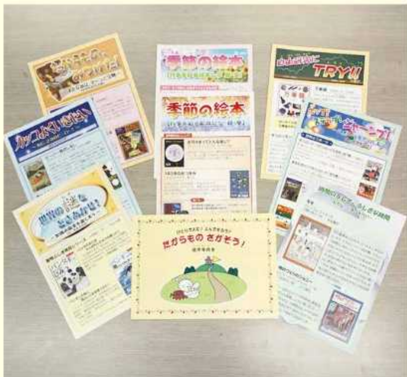
推薦図書リスト「よんでみよう」

第26号では、「ひとりでもよむ? よんでもらう? たからものさがそう」と題して低学年向けの本を紹介しています。 最近では、小学校に入学する前に字が読めるようになるお子