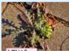
1年じゅう花を咲かせる

ノボロギク(野崎橋南) キク科キオン属 畑地や野原、公園などで1年中見られます。ポロ切れが葉まっただけに見えるので名づけられたとされる、少し気の毒な草です。