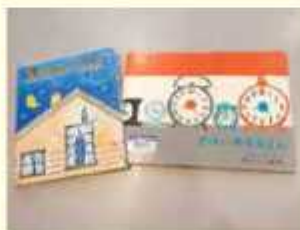
たからものは見つかるかな

さんが多いようです。けれども、字が読めることと、本を楽しんで読めることは同じではありません。 字が読めるようになっても、小学校に入学しても、お子さんが求める間は、せひ、身近にいる大人の方が本を読んであげてください。