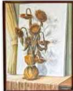
「ノスタルジア」金田茂(F80 水彩)