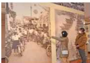
巨大写真パネルと記念撮影コーナーも

船の上に板を敷き江戸川を渡る様子や当時の冠婚葬祭など、昭和の日常を収めた写真約400点が並び、姿変わらない風景もあり、野田はゆっくりと話す女性もいた。