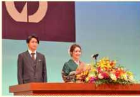
決意を新たにす新成人代表

の新たな門出を共に祝い合う式典を開催する予定でしたが、新型コロナウイルスの感染リスクを考慮し、令和3年成人式はオンライン配信（録画）による開催としました。