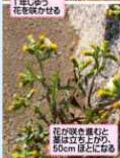
花が咲き進むと茎は立ち上がり、50cmほどになる