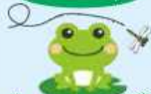
たくさんの生き物と共学