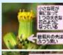
小さな花が咲き出して1つのお花を育てるのも楽しみの一つ