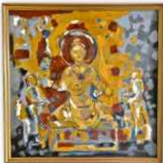
「菩薩」加藤瑞恵(S100 油彩)