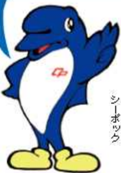
千葉警察マスコットキャラクター シーボック