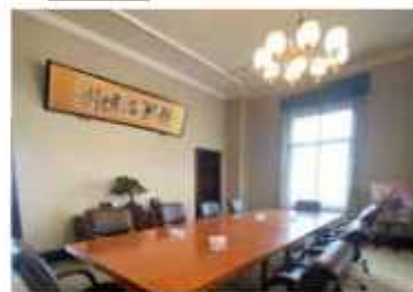
作品内で千秋社は大蔵省の設定

「華麗なる一族」のドラマ撮影が千秋社や興風会館、総合公園体育館で行われた。ドラマは4月18日回22時からWOWOWで毎週日曜に放送。配信予定は初回無料。※作：山崎豊子 監：野田高梧