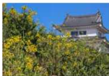
菜の花は4月まで見頃が続く

寒さも一段落した同館周辺には写真の撮影や散歩を楽しむ人の姿が見られた。マツマツの中止は残念だが、4月には満開の桜に囲まれた景色を家族と見に来たい」と話す人も。