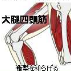
大腿四頭筋 衝撃を和らげる

ぜひ、市公式動画チャンネルで「シルバーハビリ体操 膝痛予防の体操」を見て運動してみてください。監修 東京理科大学・柳田信也准教授 [HP検索] 1030590