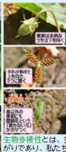
葉裏は未熟なうちは下を向く