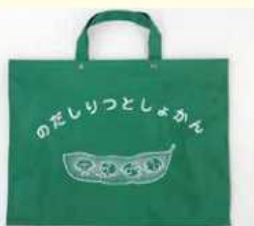
大判の大きな絵本も入れられます