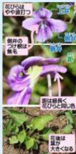
花びらはやや波打つ

3～4月頃に咲く花は少し甘い香りがします。暖かい日が続くと秋や冬に咲くこともあります。