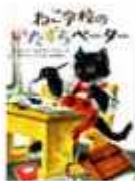
「ねこのパーマール」 アンネリース・ウムラウフ著 ニラマチュ・作 アダルベルト・ピヒル 杉山香織・訳 徳創書店

家の中には、20万種を超える生物がいるのだそう。人にとって一番身近な家という「自然」の中でどのような生態系が築かれているのか？興味を引かれること請け合ひの一冊。