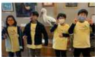
おそろいのTシャツを着て参加