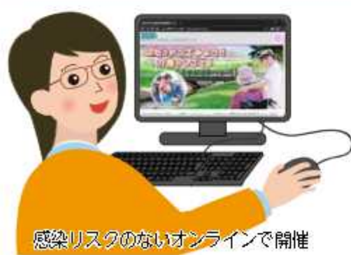
感染リスクのないオンラインで開催

行政相談センター行政苦情110番 ☎0570・090110、市役所やいちいのホールの行政相談は広報広聴課