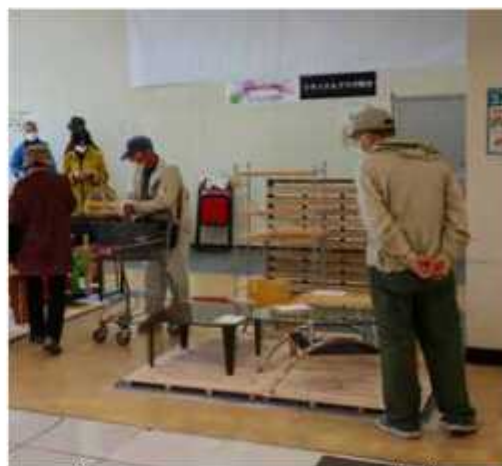
購入後1週間まで取り置きが可能

市は粗大ごみを再利用することでごみを減量し、さらにリサイクル意識の向上にもつなげようと、4月15日にイオンストアに「リサイクルプラザのだ」をオープンした。 初日は想定を超える13人が19点の展示品を購入。「まだ使えるものがごみに出されていたのかと驚いた。安く買えるので嬉しいね」という人も。