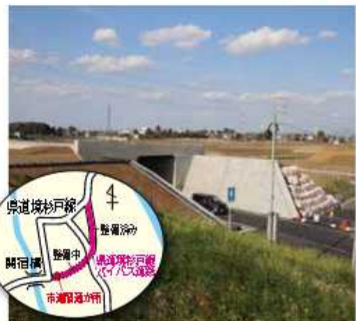
市道は4月1日から供用開始

主要地方道境杉戸線バイパスの整備事業に伴い、市道2522号線(関宿元町1410・1付近)の新バイパス道路の下を通るトンネル道路が完成した。関宿台町と関宿江戸町を結ぶ境杉戸線は、慢性的な渋滞と歩道がないため歩行者の安全確保が課題。県では令和5年度の供用開始を目指し、バイパス整備を行っている。