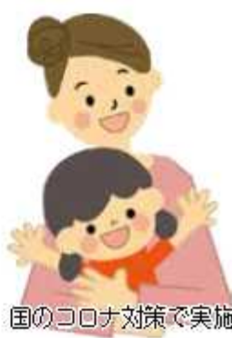
国のコロナ対策で実施

国では、新型コロナウイルス感染症の影響を受けるひとり親世帯を支援するため、児童扶養手当受給者などに特別給付金を見舞一人につき5万円支給します。 【対象者】ひとり親家庭等で①②③のいずれかに該当する方 ①令和3年4月分の児童扶養手当受給者、②公的年金などの受給で令和3年4月分の児童扶養手当の支給を受けていない、③新型コロナウイルスの影響で家計が急変するなど収入が児童扶養手当受給者と同じ水準になっている 【申込み】①申請不要で5月中旬から順次支給、②③児童家庭課や市ホームページで必要書類を確認し、令和3年6月1日頃から4年2月28日回までに同課