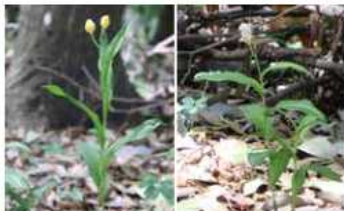
キンラン(左)とササバギンラン(右)