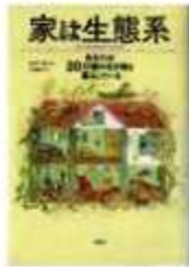
「家は生態系」 ロブ・タン著 今西麻子・訳 白揚社

東図書館 ☎7123-7611 南図書館 ☎7125-7981 北図書館 ☎7129-8811 せきやど図書館 ☎7198-4946