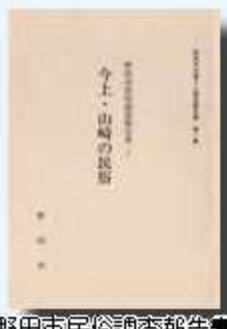
野田市民俗調査報告書

各地区の衣食住や年中行事、 □承文芸などの調査を全10巻 にまとめています。 【内巻】今上・山崎/大殿井・ 横内・鶴幸・自吹/吉善・谷 津・岩名・五木/尾崎・東全 野井/中里・小山/船形/上 花輪・野田・中野台・清水地 区の調査報告