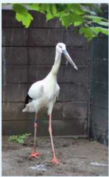
「つばさ」は同園の水生物園で公開中

また、全国のコウノトリ飼育施設19か所で18羽が飼育されています(令和2年12月時点)。 ●「コウノトリ展」を開催 8月4日(土)から10日(木)まで、