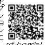
QRコードをスキャンしてInstagramにアクセスしてください

定のハッシュタグ #野田市の魅 力2021簡単夏 レシピ 編)を付けて、キャプションに 「タイトル:レシピ、野田産食材」 を記入し公式インスタグラムに 投稿してください。 8月16日(日)から9月17日(土)まで に投稿してください。 今回は魅力推進費を10人決定 します。 【問合せ】魅力推進課 【HP検索】10318892