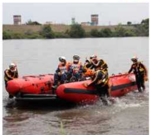
警戒レベル4では迷わず避難を

近年多発する線状降雹による大雨災害と水難事故に備えようと、消防本部では6月18日と25日に水難救助訓練を江戸川や利根川の河川敷などで実施した。訓練では、ドローンを活用し溺れた人の発見や、高機能救命ボートによる浸水区域からの救出方法などを確認。消防本部では今後もある事を想定し、水難救助訓練を続けていく。