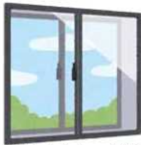
断熱効果に優れた二重窓を設置

補助対象が、これまでの一般社団法人環境共創イニシアチブに登録されている機器に加え、公益財団法人北海道環境財団に登録されている機器も対象となりました。