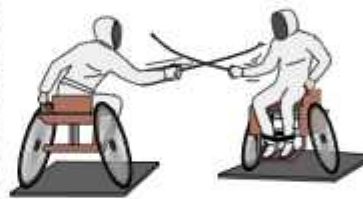
車いすフェンシング

東京2020パラリンピックのテコンドーでは、身体障がいのある選手に「キョルギ」が実施されます。基本的なルールは一般のテコンドーとほぼ同じですが、胸部への足技だけが有効で、頭部へのけりは反則です。