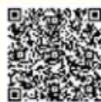
申請書ダウンロードページ