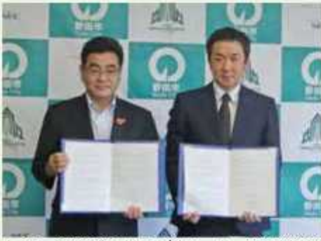
左から、野田市長、NECグリーンロケッツ権原健代表

トップリーグの「NECグリー ンロケッツ」と相互連携に関す る協定を締結しました。