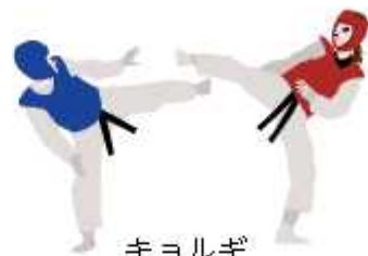
キョルギ フェンシングはピストという装置に固定した競技用車いす

東京2020パラリンピックのテコンドーでは、身体障がいのある選手に「キョルギ」が実施されます。基本的なルールは一般のテコンドーとほぼ同じですが、胸部への足技だけが有効で、頭部へのけりは反則です。