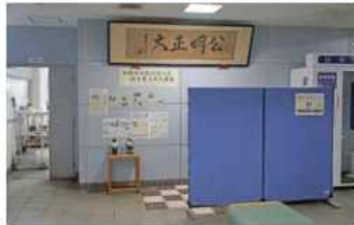
買太郎翁が野田の警察に贈った四字熟語「公明正大」の直筆の書は現在でも野田警察署のロビーに掲示