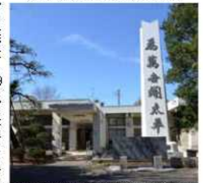
貫太郎翁宅の敷地内に建設された記念館

しかし、2年前の台風が原因の雨漏りにより臨時休館（一部見学と解説は可）となったため、改修により手急な開館を目指しました。建設から50年が経過していることから、事前に耐震診断を行うために、コンクリートの強度が著しく低下し補強するとは困難であるという結果になりました。