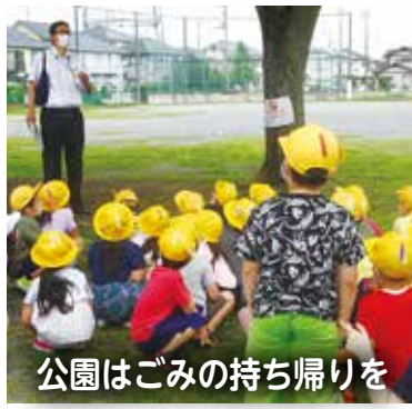
公園はごみの持ち帰りを