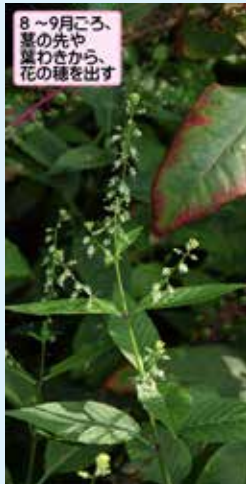
8~9月ごろ、葉の先や葉わきから、花の穂を出す

水玉草、とてもオシャレでかわいい名前です。果実にびっしりと刺が生えているんだけど、朝そこに露がつくと水玉のように見えるからつけられた名前なんです。