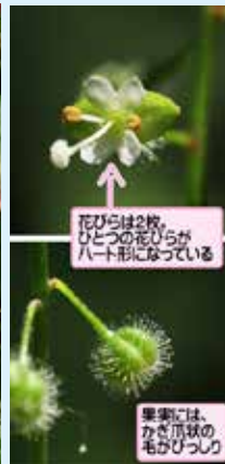
花ひらは2枚、ひとつの花ひらがハート形になっている