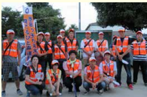
子どもたちを見守る青少年補導員

地域に根付いた非行防止活動を定着化するため、自治会などと連携した活動や、広報紙「ひとこえ」「かけはし」を通じ、補導員の活動状況をお知らせしています。また、補導員としての資質向上を目指し、研修や視察を行っています。