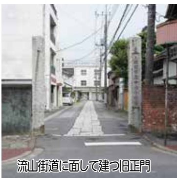
流山街道に面して建つ旧正門