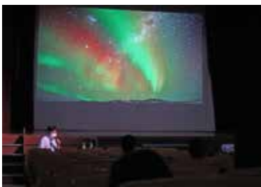
昭和基地からのオーロラの風景

子どもたちが自然に親しむよう、あおいそら運動推進委員会が主催する自然塾では7月25日に興風会館で、「映像で巡る南極の自然」と題した講演会を行った。第50 次南極地域観測越冬隊に参加した武田康男先生の体験談を聞いた。「日常で体験できないものを子どもに教えてもらえてよかった」と話す保護者も。