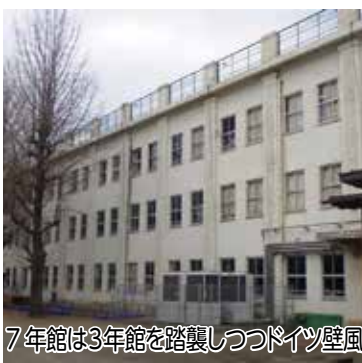
7年館は3年館を踏襲しつつドイツ壁風

3）年に起った関東大震災を契機として旧東京市が設計した「復興小学校」を範とし、耐震・耐火構造を重視しつつ先進的な教育思想を採り入れて設計され、昭和3（1928）年と昭和7（1932）