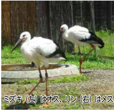
ミズキ (左) はオス、リン (右) はメス

募集締切後、「コウノトリと共生する地域づくり推進協議会」による二次選考を行い、オス・メス各5点を選定し、最終選考は、市内小学生による投票をお願いし、最多得票の愛称を採用することとなっています。