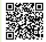
ネット予約のQRコード

市ホームページの結核・肺がん検診予約ページでは24時間予約できます。保健センター、関宿保健センターの窓口では予約受付はできません。