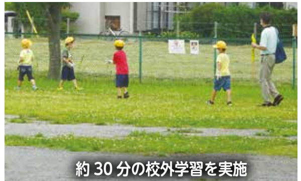
約30分の校外学習を実施