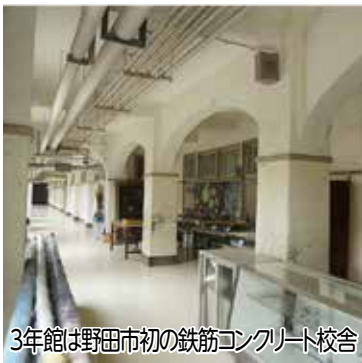
3年館は野田市初の鉄筋コンクリート校舎

所在地の入口には標識を設置していますので、災害時に備えて場所を確認しておきましょう。 ○所有者の厚意で提供していただくため、所有者の指示には従うこと ○所有者の被災状況により利用できない場合もあること ○「飲用可能」の井戸も災害時は利用者の責任で利用すること