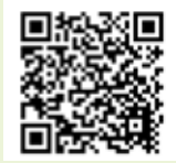
新規申請のQRコード

受診には受診券が必要ですが、新規に希望する方は保健センターや関宿保健センターに問い合わせるか、市ホームページ「ちば電子申請サービス」でも申し込みできます。