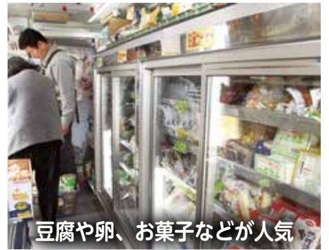
豆腐や卵、お菓子などが人気

関宿南部コース」が火曜日と金曜日、「東南部・福田コース」が水曜日と土曜日の週2回です。ステーションには、30分程度停車して販売します。