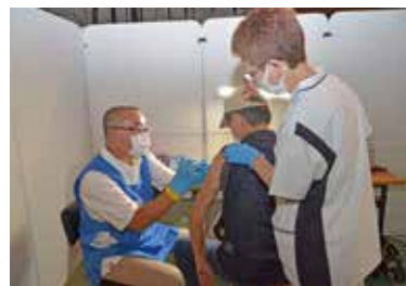
ワクチンは12 歳以上が対象

子どもたちが自然に親しむよう、あおいそら運動推進委員会が主催する自然塾では7月25日に興風会館で、「映像で巡る南極の自然」と題した講演会を行った。