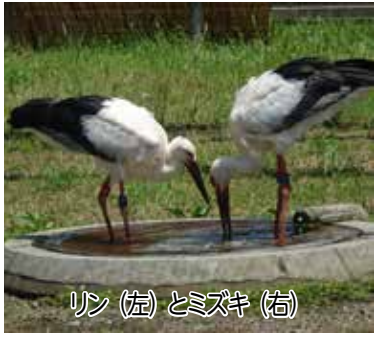
リン (左) とミズキ (右)