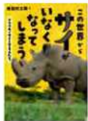
「この世界からサイがなくなってしまう」 味田村太郎・文 学研プラス

世界20か国の国旗を弁当箱に詰めたこの本。それも見た目だけでなく、各国の伝統的な食材や料理が盛り込まれた力作です。材料や作り方も載っているの、ぜひトライを。