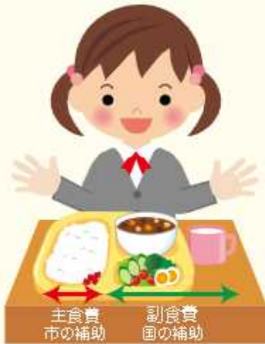
主食費 市の補助 副食費 国の補助

給食費（主食費・副食費）の補助を受けるには、申請書などの提出が必要で、今回払い戻し（償還払い）されるのは、令和3年4月～8月分です。対象の方は期限内に申請してください。