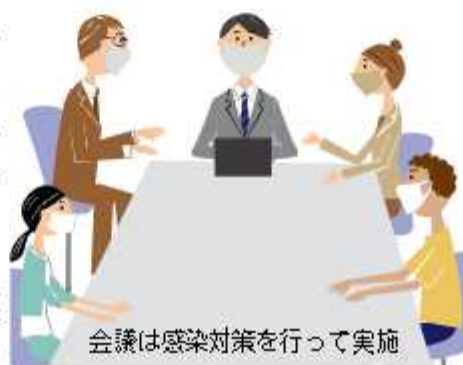
会議は感染対策を行って実施

〔案内配布場所〕担当課窓口、関宿支所、南・北・中央の各出張所、中央・東部・南部梅郷・北部・川間・福田・関宿中央・関宿・二川・木間ヶ瀬の各公民館、市役所1階行政資料コーナー（消防委員会のみ）