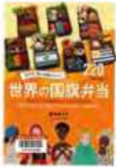
「食文化・郷土料理がわかる世界の国旗弁当」 青木ゆり子・著 誠文堂新光社

東館図書 7123-7611 南館 7125-7981 北館 7129-8811 せきやと図書 7198-4946