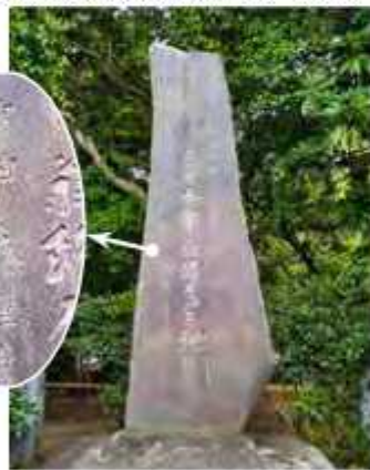
買太郎翁が生誕を終えた場所には石碑の揮毫は吉田茂によるもの(鈴木買太郎記念館敷地内)