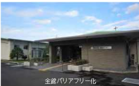
全館バリアフリー化

原則として60歳以上の方のいきいきクラブの会費などは無料利用できます。利用は事前