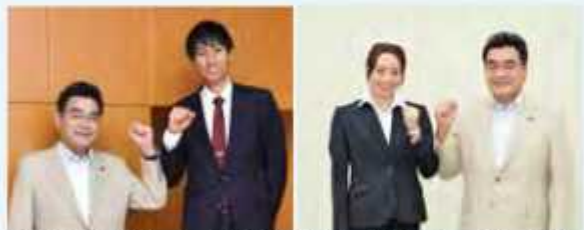
応援してくださった市民の皆さま、どうもありがとうございました。3年後のパリに向かって頑張ります