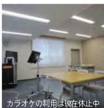
カラオケの利用は現在休止中