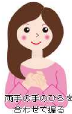
両手の手のひらを合わせて握る

市では、小中学生に手話への理解を広めようと、絵本や漫画によるオリジナル啓発冊子「きょうからともだち」を作成しました(現在、配布は終了)。冊子の題名にもある「ともだち」を手話で表現し、周りの人と友達の輪を広げていきましよう。