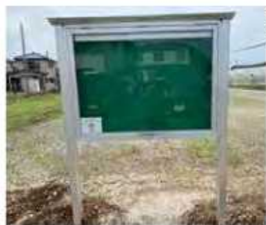
掲示板で地域の皆さんへ情報発信

◆宝くじの助成金で自治会活動用品を整備 (一財)自治総合センターのコミュニティ助成事業を利用して羽衣3自治会の備品(掲示板・物書き・音響機器など)を購入。園市民生活課