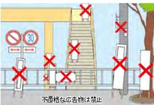
不適格な広告物は禁止

9月1日から10日までは「屋外広告物適正化旬間」です。屋外広告物は設置場所や大きさなどが条例で規制されていますので、掲示前には必ず市に相談し許可申請してください。掲示できない場所は原則道路標識・電柱・ガードレール・信号機・街灯柱・街路樹トンネル・橋・郵便ポスト・電話ボックス・道路路面・道路分岐帯・歩道橋などです。 【問合せ】都市計画課 【HP検索】10011199