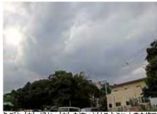
ミズキ(左)がリン(右)を追いかけるように上空を旋回