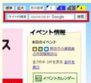
検索番号はページ右上に入力