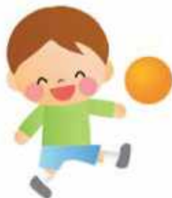
野球遊びの指導も

ボール遊びが運動を始めるきっかけになるよう、10月30日（雨）10時から17時まで（雨天中止）、総合公園野球場で親子で楽しむボール遊び運動教室を開催します。 【対象】1〜6歳（年齢別に3クラスで実施） 【定員】各15人（抽選） 【申込み】9月15日（日）〜10月15日（日）に専用フォームで（感染状況で中止の場合あり） 【問合せ】魅力推進課 【HP検索】100300816