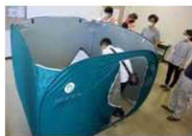
発熱者は部屋を別に

しているが、今年はおこなわれる緊急事態宣言下のため、訓練会場すべての避難所で職員のみの実施。避難所での感染対策を強化するため、発熱した方との動線を分けて開設することなどを確認した。