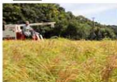
近くにはコウノトリの人工巣塔も

ぼを休耕田にしないために職員が米作りを行った。「収穫後の田んぼにはたくさん生き物がいるので、放鳥したコウノトリもまだ江川地区にいてくれるね」と職員が話していた。