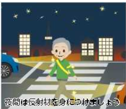
夜間は反射材を身につけましょう