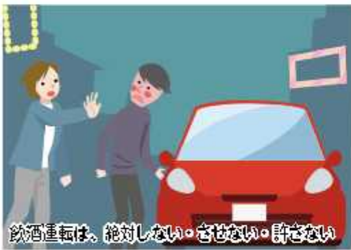
飲酒運転は、絶対しない・させない・許さない