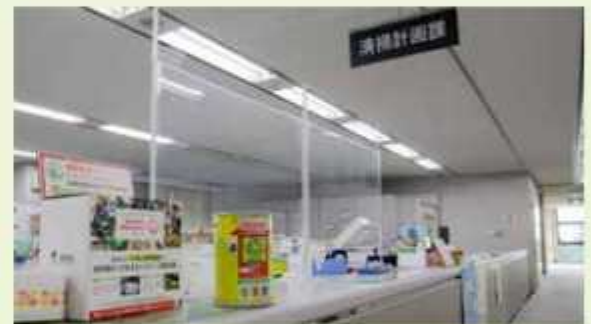
充電式電池の回収缶（写真は清掃計画課窓口）

野田市清掃工場、野田市リサイクルセンターでも、黄色い缶で充電式電池を回収しています。