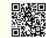
ロケーションシステム