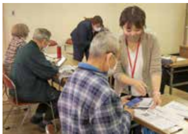
教われれば二次元コードも簡単に

電源の入れ方からインターネットの検索方法、デジタルカメラの操作なども受講。二次元コードを利用して、まめメールの配信を登録し、安全安心につながる使い方もできるようになった。