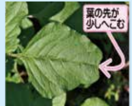
葉の先が少へこむ

日当たりの良い畑地などに生える1年草です。ヒユに似ていますがヒユではなく、葉先がへこむ傾向があります。