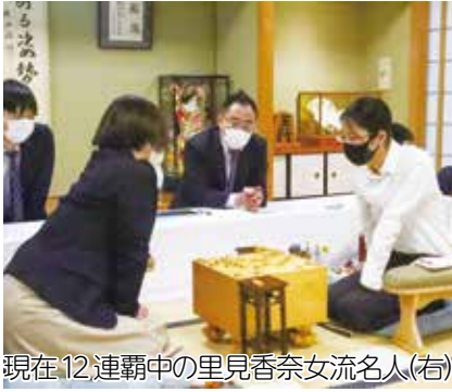
現在12連覇中の里見香奈女流名人(右)