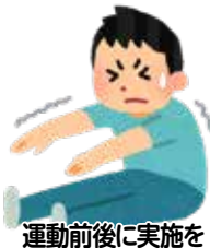
運動前後に実施を