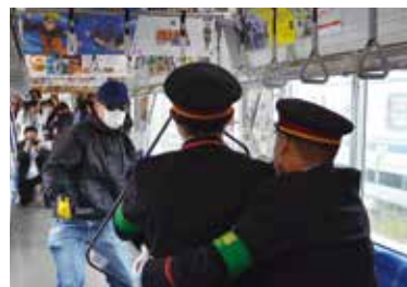
車内で刃物事件を想定して訓練

市や商業施設職員も参加し、凶器に対する体の構えや犯人と相対する際の心構えを学んだ。「無理に戦おうとせず、お客様の安全と自分の命を第一に守りたい」と参加者は話していた。