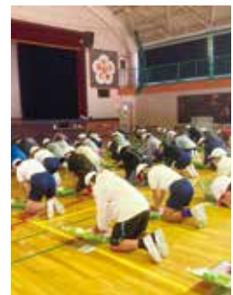
今年度も10月から開始