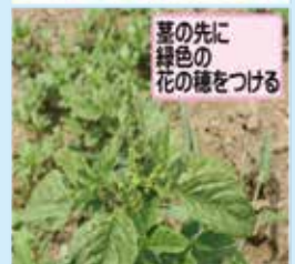
葉の先に緑色の花の穂をつける