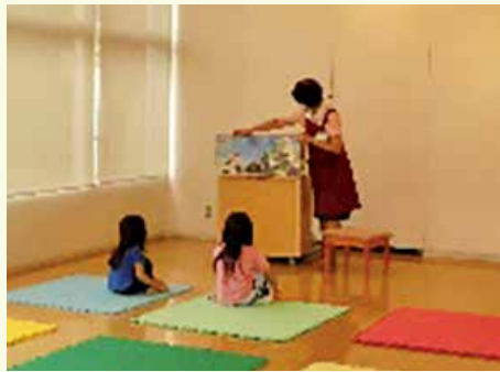
職員はマスクを着用して読み聞かせ