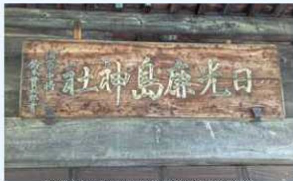
賈太郎翁は50歳で海軍中将に昇進

いと川崎帰っちゃったのかな」と、泣き出したと言われています。その栃木県足利市川崎町に隣接する大久保町にある「日光鹿島神社」の扁額（建物に掲出される額）の文字は賈太郎翁の揮毫になります。現在残る揮毫の多くは、海軍大将や侍従長時代のもですが、この扁額は海軍中将時代のもので珍しいものです。