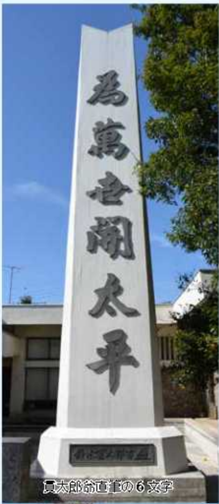
真太郎翁直筆の6文字