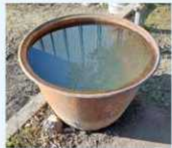
入浴は火傷しないよう底板を熱いた