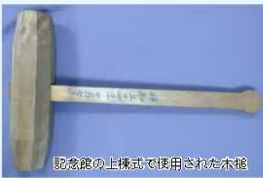
記念館の上棟式で使用された木槌

この型木は、字を埋め込むくぼみを作るためのものです。他の字の型木は固まったコンクリートから剥がす際に壊れてしまっており、唯一原型を留める形で残っていたのが「為」の型木だけでした。