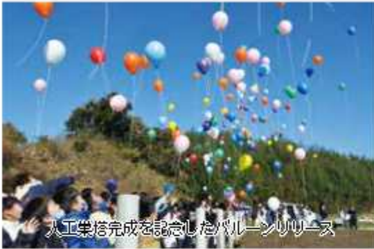
人工集塔完成を記念したバルーンリリース