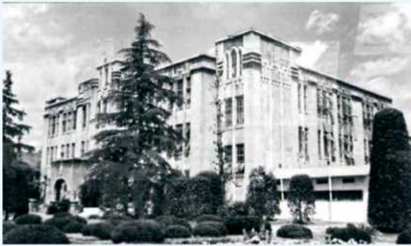
茨城県立境高校 旧校舎

だから、彼は友達と遊んで帰 ってきても学校に行って帰って きても、お母さんの姿が見えな