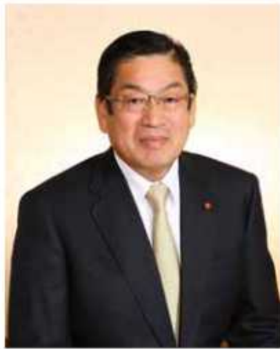
野田市長 平井正一