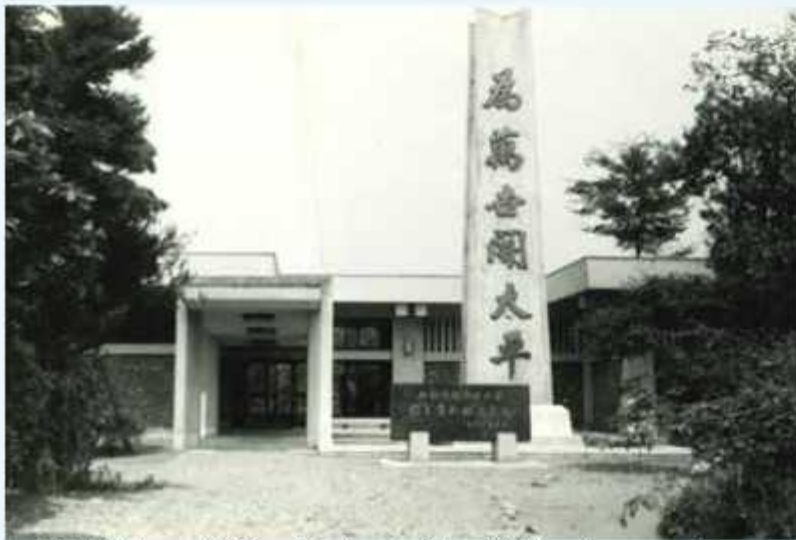
開館当時では塔碑の「太」の点がなぜか塗られていなかった