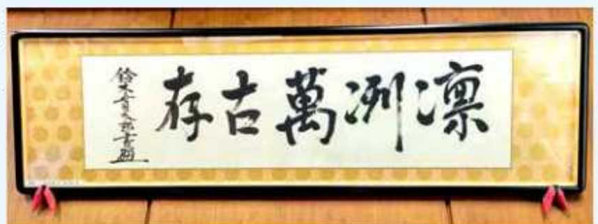
茨城県立境高校の校長室内に残る貫太郎翁の書