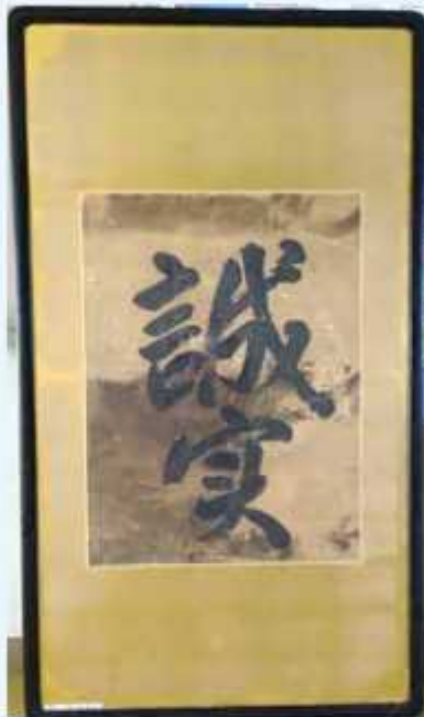
一対のため番名は片方にのみ