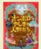
おぼろの人の家 フランシス・ホヰン・パーネット・著 尾崎 翠子・訳 早稲田大学出版部

鳥取図書館☎7123-7611 南図書館☎7125-7981 北図書館☎7129-8811 せせり図書館☎7198-4946