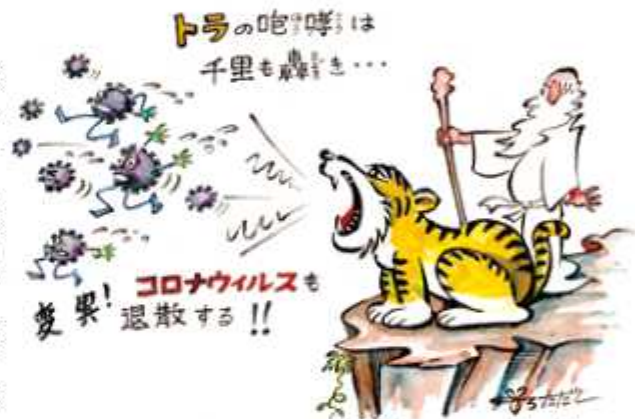
イラスト=稲葉多太司さん(清水)