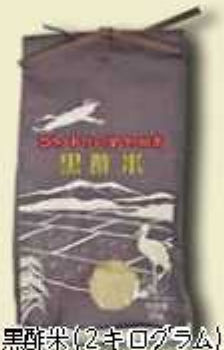
黒酢米(2キログラム)

の中から抽選で10名様に「図書 カード」と「黒酢米」をセットに して進呈いたします。 ※市ホームページ「市報のだ」の ページからも応募でき、正解と当 選発表は2月1日号。当選者氏 名の紙面掲載につき「了承」くださ い