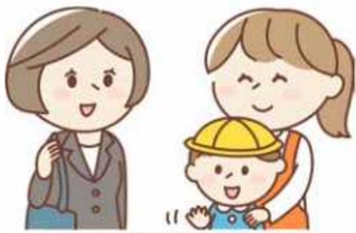
休日でも保育の不安のない野田に