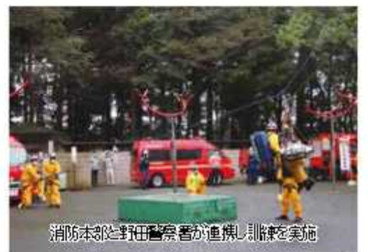
消防本部と野田警察署が連携し訓練を実施