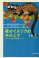
夜のイナジクの木の上で 中林 雅・著 京都大学学術出版会