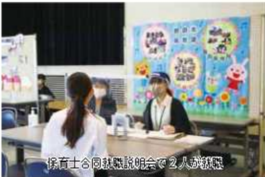
保育士合同就職説明会で2人が就職