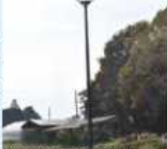
江川地区にも設置予定

市では、クラウドファンディングで集まった寄附金を活用し、木間ヶ瀬地区に人工巣塔を設置しました。