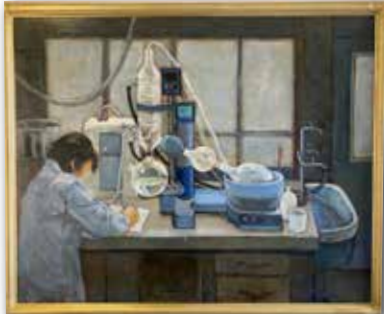
「化学実験室」有賀敏明 (F100 油彩)