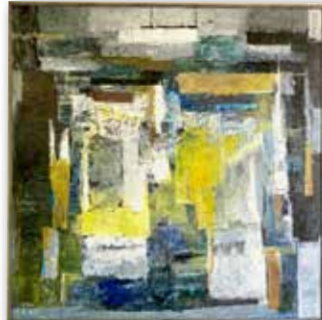
「光と時間の話」土佐マサ子(S100 油彩)