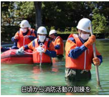
日頃から消防活動の訓練を

近年では、働き方が多様化して、地元で働く人だけでなく市外に勤めている人も多くなっています。