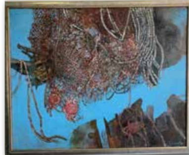
「浜辺にて」藤本敏子 (F100 油彩)