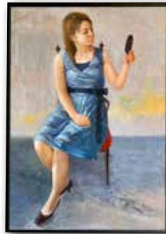
「装う」鈴木佳代子 (P100 油彩)