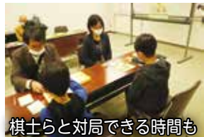
棋士らと対局できる時間も

2月6日回「第48期岡田美術館林女流名人戦五番勝負第3局」に合わせ、将棋の魅力に触れてもらおうと、2月5日回「宝珠花小僧将棋まつり」を関宿「コミュニケーション会館(いちいのホール)内」にて開催します。