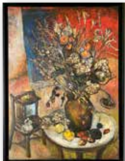
「秋に寄せて」荒木千賀子 (F100 油彩)