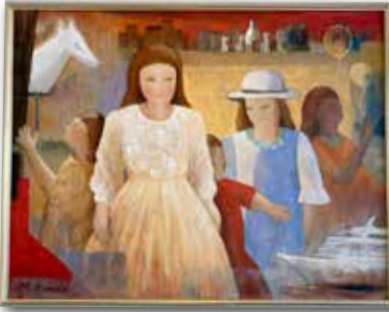
「願い、いつかきっと」近藤みち子(F50 油彩)