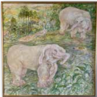
「普賢菩薩の象」塩川雅子 (F80 水彩)