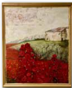
「アマポーラ咲く」小出賀子(F100 油彩)