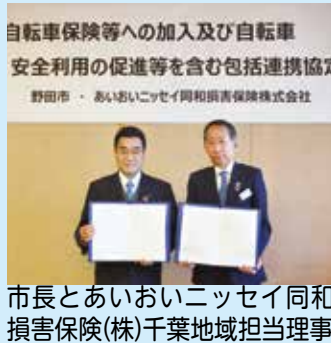
市長とあいおいニッセイ同和損害保険(株)千葉地域担当理事

12月23日には、あいおいニッセイ同和損害保険株式会社、損害保険ジャパン株式会社と包括連携協定を締結しま