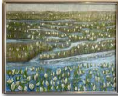
「水ばしょう」岡田金治 (F 40 日本画)