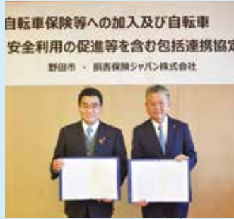
市長と損害保険ジャパン(株)千葉西支店支店長