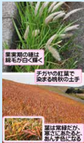
果実期の穂は綿毛が白く輝く

日当たりの良い場所に群生します。開花前の穂はかむとがすかに甘く、昔は子どもたちがおやつ代わりにかんで見られたそうです。