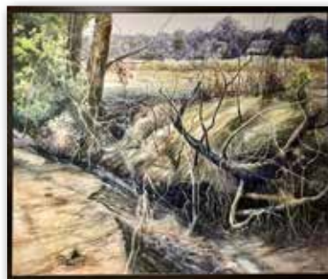
「待春譜」古橋豊人 (F130 油彩)