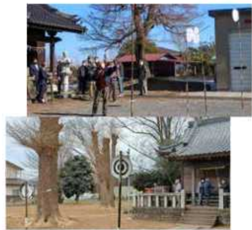
香取神社(上)と日枝神社(下)

木野崎・香取神社では1月9日、東玉珠花・日枝神社では10日にオビシヤが行われた。オビシヤは、利根川・江戸川流域を中心に関東各地に今も残る新春の民俗行事。