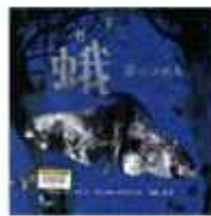
「蛾 姿はかわる」 イザベル・トーマス・文 ダニエル・イグナス・絵 青山南・駅 化学同人

きれいな花を咲かせていても、触ったり、口に入れたりすると有毒で危険な植物がたくさんあります。身近に潜んでいる植物の知識を深めてみませんか。