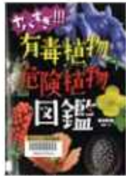
「ヤバすぎ!!! 有毒植物・危険植物図鑑」 保谷 彰彦・写真・文 あかね書房

東図書館 ☎7123-7611 南図書館 ☎7125-7981 北図書館 ☎7129-8811 セキやど図書館 ☎7198-4946