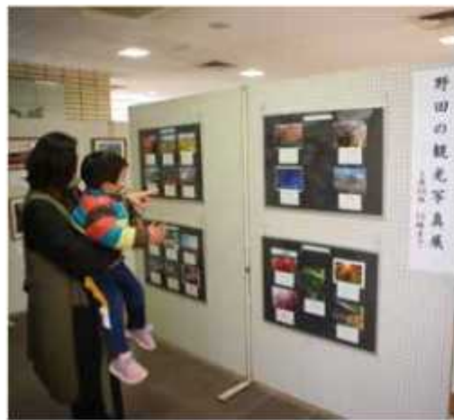
写真を通して魅力的な野田の風景を発見

市では、野田の四季や歴史的建造物などをテーマにした野田の観光写真展を1月12日から19日のホールロビーで、19日から25日まで市役所ふれあいギャラリーで実施し、市内外から応募された69点を展示した。 季節感に富んだ写真を見て「こんないい場所が野田にあったなんて。自分も同じ場所に撮りに行きたい」と話す方も。