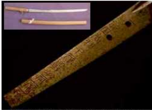
銘は刀の作者が自身の名前などを記したもの