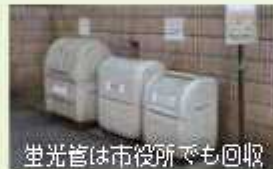
蛍光管は市役所でも回収

蛍光管は、水銀による環境汚染の原因になりますので、市では有害ごみに分別しています。捨てる方は、ごみ減量協力店（ごみの出し方・資源の出し方パンフレット参照）の専用回収箱、清掃工場やリサイクルセンター、市役所（杜の広場内）、南北コミュニティセンター、櫻のホール、いちいのホール、北部・関宿中央・関宿・二川・木間ヶ瀬公民館・七光台・島会館に設置した回収ボックスに出してください。