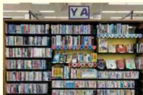
南図書館のYA(ヤングアダルト)コーナー

いよなどの人気シリーズもそろえています。視聴覚コーナーをぜひ、利用してください。 【問合せ】興風図書館 ☎7123-7611