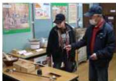
道具から昔の生活に思いを馳せて

通勤通学や買い物ついでに愛宕駅前に出張所オープン 市では、買い物ついでや通勤通学の帰りに利用できる愛宕駅前に出張所を2月1日、ヨークプライス野田店内にオープンした。