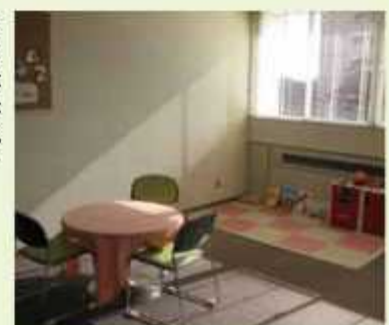
相談室は消毒や換気を徹底

出産後に家族などから十分な支援が受けられず、育児不安や赤ちゃんのお世話に不安を感じている家庭に、助産師が訪問して母子の身のケアや育児をサポートする産後ケア事業をしています。