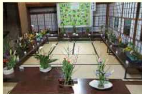
生け花（クラブフェスタ）