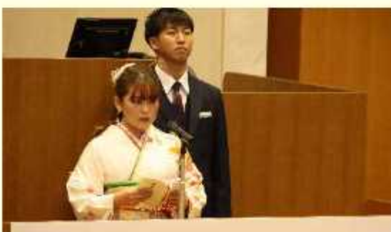
野田市では20歳の方をお祝い