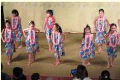
ハワイアンフラ（クラブフェスタ）