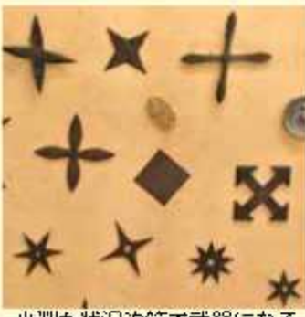
小判も状況次第で武器になる