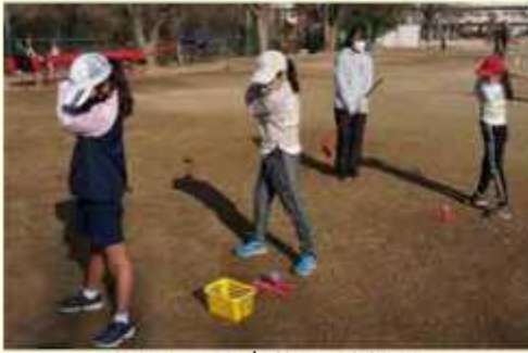
スナッグゴルフ（練習）