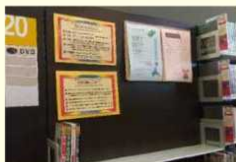
興風図書館2階 DVDコーナー

借りたい資料が決まっていないうちから一冊を探すと、興味があるものに出会えるかもしれません。操作方法がわからない時は、お気軽に職員に質問ください。