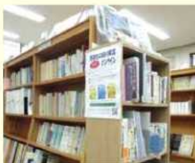
北図書館 郷土資料コーナー

調べものをするための閲覧席付近には、野田市や千葉県に關わる本を集めた郷土資料コーナーがあります。地域にまつわる偉人の伝記や郷土史、行政資料のほか、野田市や近隣の市町村に縁のある作家が手掛けた著作もこちらに集めています。