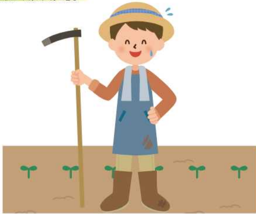
■募集中の市民農園

言や指導を受けながら野菜や草花を栽培できます。 現在、6つの市民農園で利用者募集しています。農園の年間利用料金は、1区画 30平方