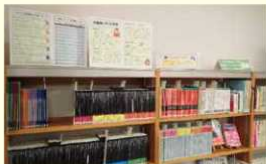
せきやど図書館 英語多読コーナー

多読とは、辞書を引いたり訳したりせずに元の言語のまま本を読み、大筋を把握する学習方法です。細かいニュアンスや分からない単語などをひとつひとつ調べずに読み進めることで、たくさん英語に触れることができます。