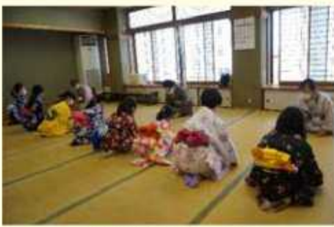
日常のお作法（稽古）