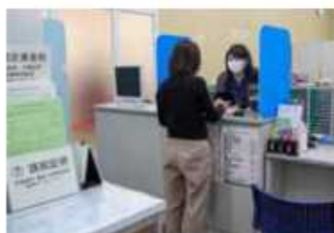
土曜日の窓口利用は愛宕駅前へ

平日は9時から20時まで、土曜日は9時から17時30分まで受付。「スーパーと市役所に行く予定が一度に済むから便利ね」と買い物カートを押しながら窓口を眺める人も。