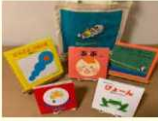
出生祝いのブックスタート

当日、相談会場には絵本紹介 のポスターも用意しています。不 明な点があればお気軽に声を掛 けてください。