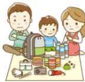
食料は賞味期限の確認も