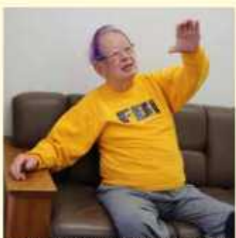
奥様からの提案で髪の毛は紫色に

以外にも薬学や栄養学の教えもあって、私も自分で玄米を炊いて食べたり、冷水摩擦をしたりしましたが、若い時から養生しても短命な人もいるし、不養生でも長命な人もいますし、自分で90歳まで生きてきてわかったことは、運が決めることだどつくづく思います。