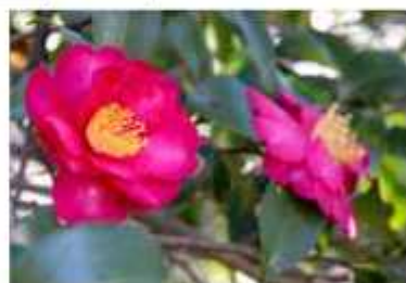
園内には約2.5キロの散策路も

同園内では3月になると、50本以上の紅白梅が見頃を迎える。「ツバキも例年より開花が遅いから、梅もコロナ禍が収まった頃にちょうど満開になるかもね」と話す来園者もいた。