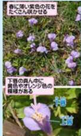
香に薄い紫色の花をたくさん咲かせる

湿った野原や畦などに多い多年草で市内全域で見られます。群生すると一面が紫の絨毯に見えます。美しい花は園芸植物や山野草としても人気です。