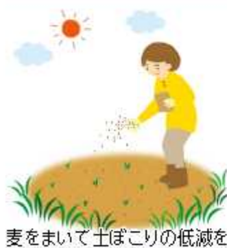
麦をまいて土ほこりの低減を

【配布量】千平方メートル（10アール）あたり1キログラム程度 【申請期間】4月1日圏～5月27日圏（平日のみ） 【問合せ】農政課 【HP検索】10155543