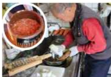
大豆・人参・大根を酢と砂糖で

「縁起物で毎年旧暦の初午の頃に食べます。我が家の作り方は子どもの頃から変わらないやり方で「すよ」と。火を使わない調理法は鎌倉時代までさかのぼり、この料理では珍しい。