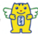
「めいすいくん」 明るい選挙キャラクター