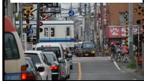
春日部駅周辺 踏切による渋滞

【春日部市】 ◇春日部駅付近連続立体交差事業の早期完成及び 中心市街地活性化への支援 ◇東武伊勢崎線一ノ割駅のホームの上屋・防風壁の 延長及び拡幅