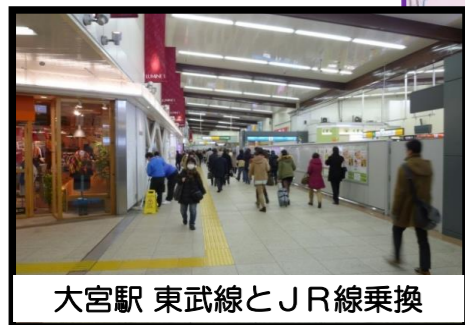
大宮駅 東武線とJR線乗換

【杉戸町】 ◇県内への移住定住増加の促進や、人流増加を目指すための、鉄道沿線自治体との活動の実施及び支援