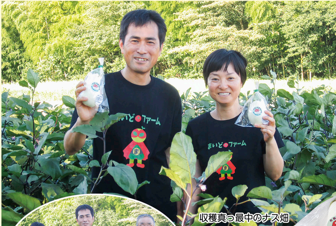
収穫真っ最中のナス畑