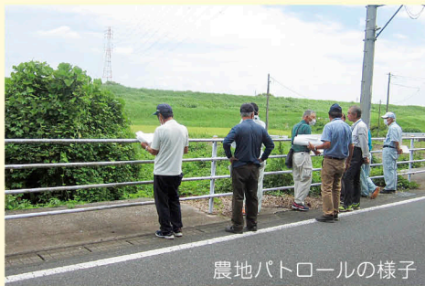
農地パトロールの様子

この調査は毎年1回実施することが法律で定められており、農地が適切に管理されているかを把握するために農地利用最適化推進委員と農業委員が農地パトロールを実施するものです。