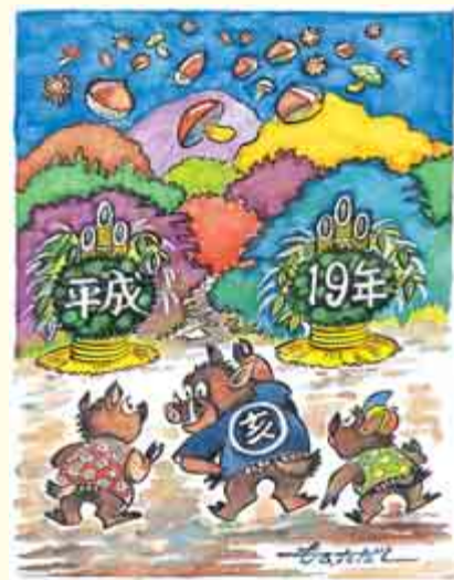
イラスト＝稲葉多太司さん(清水)

ば「猪突猛進」。生活の利便性を求めて、猪突猛進せず、イノシシなどの野生動物植物と共存するためにも、自然環境を保全し、大切な生息地を守ってあげたいものです。