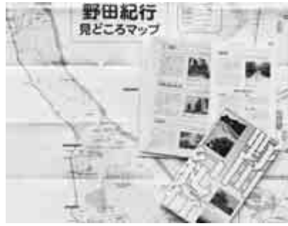
オリジナルマップ付きで市内を紹介

市では、野田市の魅力を、カラー写真と解説文で紹介した野田市ガイドブック「野田紀行」を販売しています。