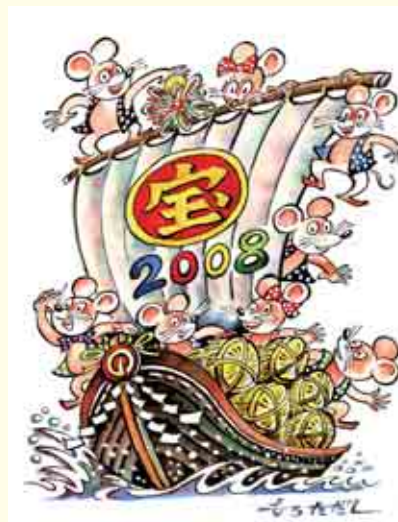
イラスト：稲葉多太司さん(清水)

分布、生息する哺乳類で、種類も千800に及ぶといわれています。「ネズミ算的に増える」という言葉からもわかるように、1回に20匹近く子を産む種類もあるほど、繁殖力が強い動物です。