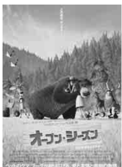
熊のブーグが大活躍