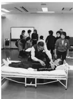
ベッドからの起こし方も