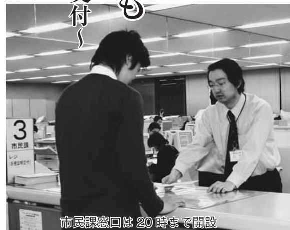
市民課窓口は20時まで開設

さらに、19年9月からは、日曜日の8時30分から17時15分まで、市税の収納や納税相談のために開設している市役所2階の収納課窓口で、住民票の写しの交付も行うています。