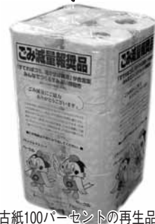
古紙100パーセントの再生品

引き換えは、6、7面に掲載している指定ごみ袋取扱店で行ってください。 【問合せ】 資源回収のことは清掃計画課／ごみ収集、不法投棄のことは清掃第一課 ☎7138-11001・関宿クリーンセンター ☎7196-0022