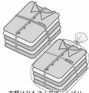
衣類はひもで十文字にしぼり、雨の日は透明なビニール袋に入れる

基本的には洗濯し、適当な大きさにたたみ、ひもで十文字に縛り、ボタンやファスナーはつけたままを出してください。汚れのひどいものや濡れたものは、対象外です。また、制服や布団など綿の入ったもの、カーペット、ストッキング、雨具類、ぬいぐるみなど衣類以外のもの