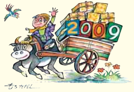
イラスト=稲葉多太司さん(清水)

のは、新石器時代あたりが起源といわれています。 日本でも、縄文時代に牛が飼われていたという説がありますが、以来、乳牛や肉牛をはじめ、農耕や運搬の動力とする役牛などとしても、活躍してきました。 牛と聞いてイメージするのは、牧場の風景によく似合う白と黒のホルスタインですが、年賀状などのイラストには、茶系の 牛も多く登場しています。今年はいしではなく、のんびりといきたいものです。 (引越してきました!!ヨロシクね...)