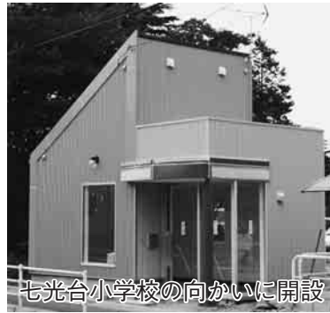
七光台小学校の向かいに開設

で、早晚実施する必要があるもので、さらに前倒しで実施することにより、市民の税金である一般財源負担が軽減されるものを選択することとしました。経済危機対策臨時交付金を活用することで、①川間駅のバリアフリー化設備整備事業を22年度