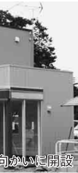
七光台小学校の向かいに開設

で不要不急な仕事を増やし、将来の財政負担を増大させてはいいないということです。前者は、交付金をほとんどすべての自治体が使うことになるはずで、野田市だけが国の財政がかくあるべしということに使わないうというの、景気の悪さの中で