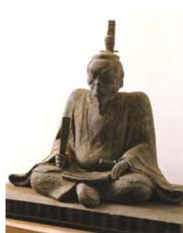
平将門像(國王神社所蔵)