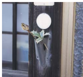
年中行事 ＜コラム＞ 節分と春来る鬼