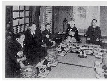
家族・親族 ＜コラム＞ 家族と親族