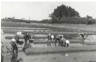
生業 ＜コラム＞ 生業の変貌