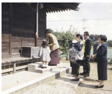
人生儀礼 ＜コラム＞ 婚姻と出産の民俗