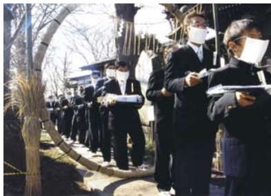
村落社会 ＜コラム＞ オビシャ