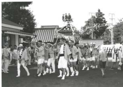
民間信仰 ＜コラム＞ 大杉神社の夏祭り