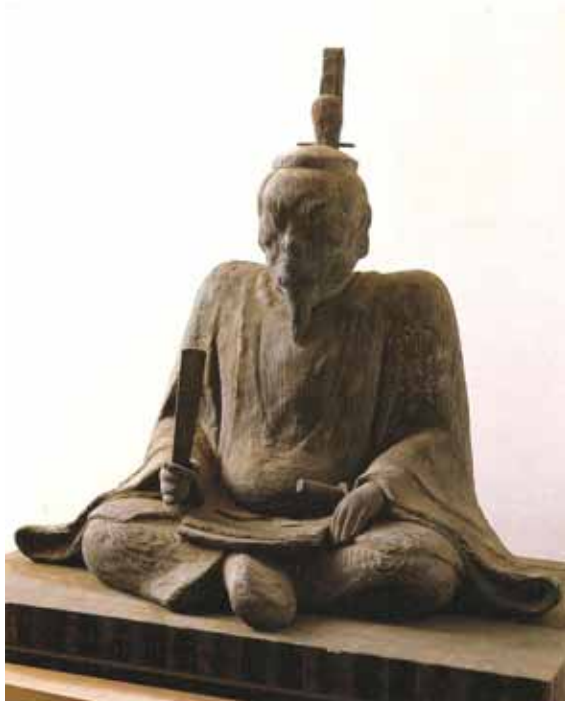
平将門像（坂東市 国王神社所蔵）