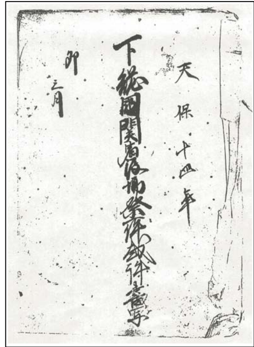
天保 14 年下総国関宿渡場祭一件裁許書写 (幸手市 増田栄家文書)

この史料は、天保 13 年(1844)6 月 13 日、関宿町の鎮守(ちんじゅ)天王社(てんのうしゃ) (関宿江戸町の香取神社)の祭礼で起こったある騒乱事件を記録したものです。この時期は、老中水野忠邦(ろうじゅうみづのただくに)によって天保改革が進められており、とくに派手になりやすかった祭礼には大きな規制がかけられていました。ところが、この年の関宿町の祭礼では、この規制に反して踊り子や囃し方(はやしかた)を大勢集め、揃いの浴衣を誂(あつら)えるなど、盛大に祭りを催したため、関東取締出役(かんとうとりしまりしゅつやく) (通称八州廻りはっしゅうまわり)がその取り締まりに乗り出したのです。しかし、町の人々は逆に大勢でこの関東取締出役やその関係者を襲撃してしまい、翌天保 14 年 3 月になって多くの人々が追放や罰金などの処罰を受けました。