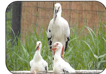
野田市ここのりの里