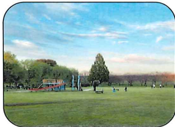
●野田市スポーツ公園