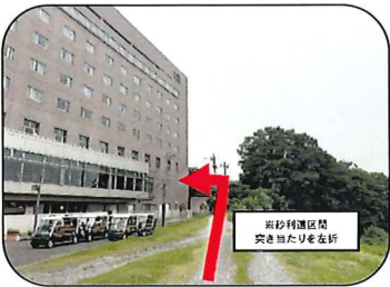
●クリアビューゴルフクラブ&ホテル