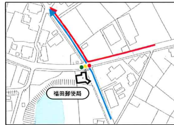
●福田郵便局 周辺拡大図