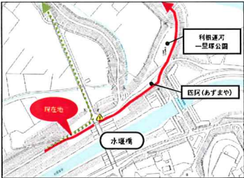
●水堰(すいせき)橋 周辺拡大図