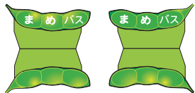
②えだまめオブジェ