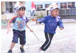
ちゃんばらごっこ

毎月複数回以上行われる行事の豊富さは、大きな特徴です。季節の行事、伝統行事、大自然を体感する行事などが、一年を彩ります。特に、成長を表現する運動会、保育表現発表会では、子どもたちは大きな感動を味わいます。成長を促す行事を、わたしたちは大切にしています。