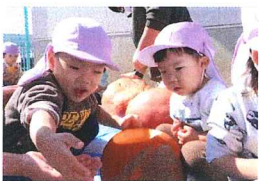
ハロウインの準備