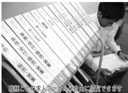
職種ごとの求人ファイルは自由に閲覧できます

全国的に厳しい雇用情勢が続く中で、市では平成16年に「無料職業紹介所」を開設し、職業相談員が直接事業所を訪問して聞き取り、市独自の求人情報の提供を行ってきました。また、19年からは障害者の求人開拓も行い、さらに今年5月からは、厳しい生活環境に置かれているひとり親家庭の就労を支援しようと、ひとり親家庭の親も対象となる求人情報の提供を始めました。