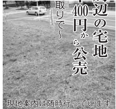
現地案内は随時行っています

市では、関宿地域の中心市街地としてのまちづくりを進めている。次木親野井特定土地区画整理事業地区内の宅地(市保留地)を公売しています。全8区画で、水道と公共下水道も整備済みです。