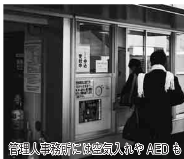
管理事務所には空気入れやAEDも

通学のため、3階にのっていますが、朝の忙しい時間でも、ベルトコンベアーがあるので、とても安心です。何より学生が月額500円なのが嬉しいです。