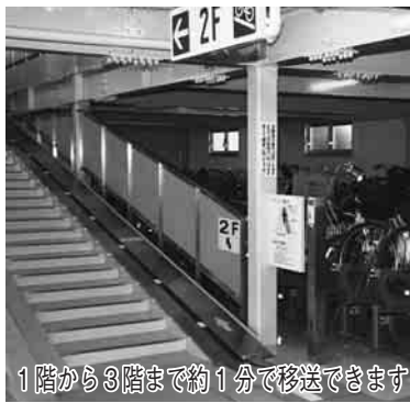
1階から3階まで約1分で移送できます

◆ 移送に役立つベルトコンベアー 地下1階、地上3階建ての梅郷駅東口市営駐輪場には、上層階への移動に便利な自走式ベルトコンベアーを設置しています。