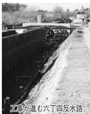
工事が進む六丁四反水路

市では、合併に際し、野田・関宿両地域の均衡ある発展を目指す「江戸川左岸連絡道路」の拡幅工事と、関宿地域の浸水対策として「六丁四反水路」の改修工事を、新市建設計画の重点課題の一つにかかげ、取り組んでいます。