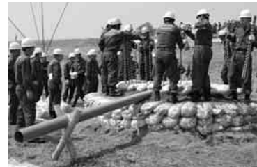
漏水を抑える工法も