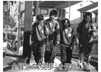
全員での「完歩」を目指して

毎年11月には、学校から関宿中央ターミナルまで、往復22キロメートルを歩く「ロングウォーク」が行われますが、全学年で