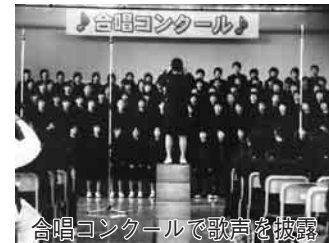
合唱コンクールで歌声を披露

を、一足早く体験してもらいました。ほかにも、今月15日には、柏市の高校の吹奏楽部の協力で、マーチングバンドのコンサートを開催しますが、「三世代交流会」として、小学生や保護者、同じ地区のいきいきクラブの皆さんを招待し、地域にも仲間づくりの輪を広げています。